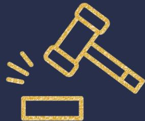
7. Riesgo Legal

Como resultado de mas de dos décadas estudiando y entendiendo los problemas que enfrentan los dueños de PYMES, se creó el Método Bristol .